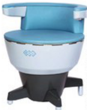
Trainingsstuhl „BTL Emsella“, sechs Einheiten à 30 Minuten ca. 1000 Euro. Z. B. im „Haut- und Laserzentrum an der Oper“ in München

Nahezu jede vierte Frau leidet in Deutschland unter Harndrang oder Inkontinenz, weil die Core-Muskeln durch Schwangerschaft, Wechseljahre oder Übergewicht erschlafft sind. Abhilfe schafft gezielter Sport, oder jetzt ein komfortabler Hightech-Sessel, der den Muskelbereich innerhalb von 30 Minuten wieder in Schwung bringt. Der BTL-Emsella-Stuhl arbeitet mit fokussierter elektromagnetischer Energie. Ein echter Wow-Effekt: Das Kribbeln im gesamten Beckenboden zeigt an, wie die Muskeln in Bewegung kommen. Aber keine Sorge! Sie bleiben während der Behandlung komplett angezogen.